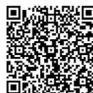
Sportunion - Gewaltformen