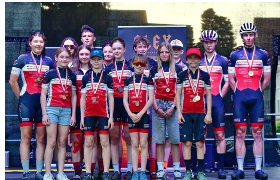
Erfolgreiche XCE-ÖM und LM am Dornbirner Marktplatz.