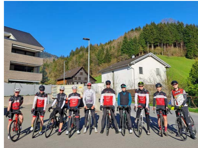
Start April 2025: Treffpunkt Trendholz Dornbirn, erstes Rennradtraining.