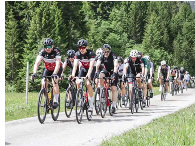
Die reaktivierte Rennradgruppe fördert das Rennradfahren in Gesellschaft.

Diese sportlichen Leistungen unterstreichen die erfolgreiche Rückkehr des Rennradsports beim RV Dornbirn und bilden eine starke Basis für die kommenden Jahre.