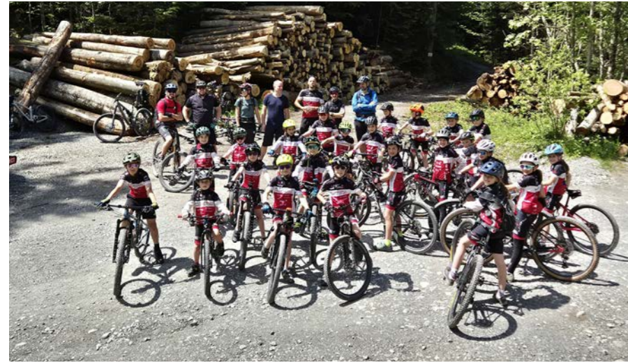
Voll motiviert peadalierten die RV-Dornbirn Kids gemeinsam mit ihren Trainern zum KidsBikeCamp.