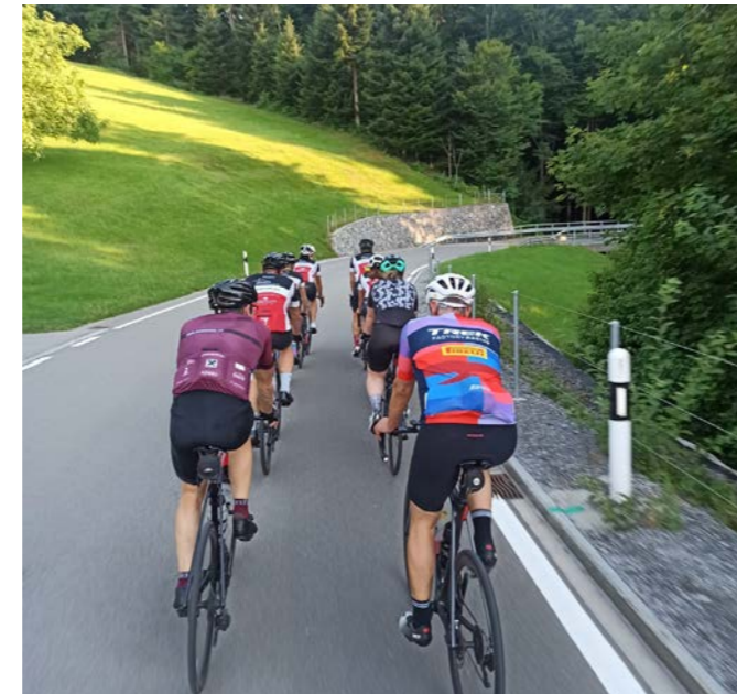
Jeden Donnerstag trifft sich die Rennradgruppe zum gemeinsamen Training.