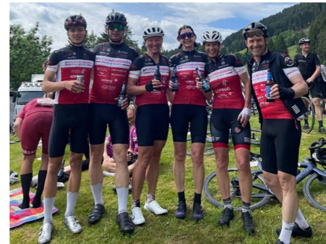
Auch der Spaß kommt nicht zu kurz.