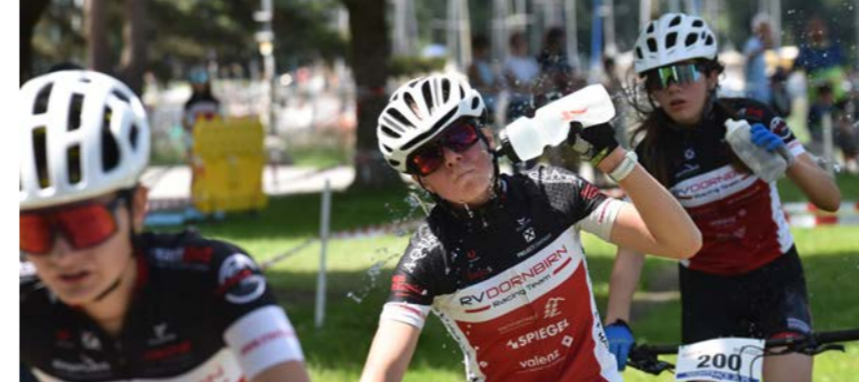
Geballte RVD-Frauenpower bei den Landesmeisterschaften in Hard.