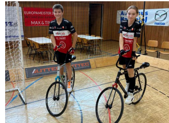
Immer mehr Mädchen finden zum Radball-Sport.