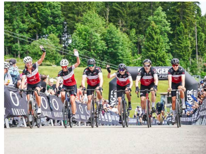
Erstes gemeinsames Rennen als RV Dornbirn Gruppe beim Race One Twenty.